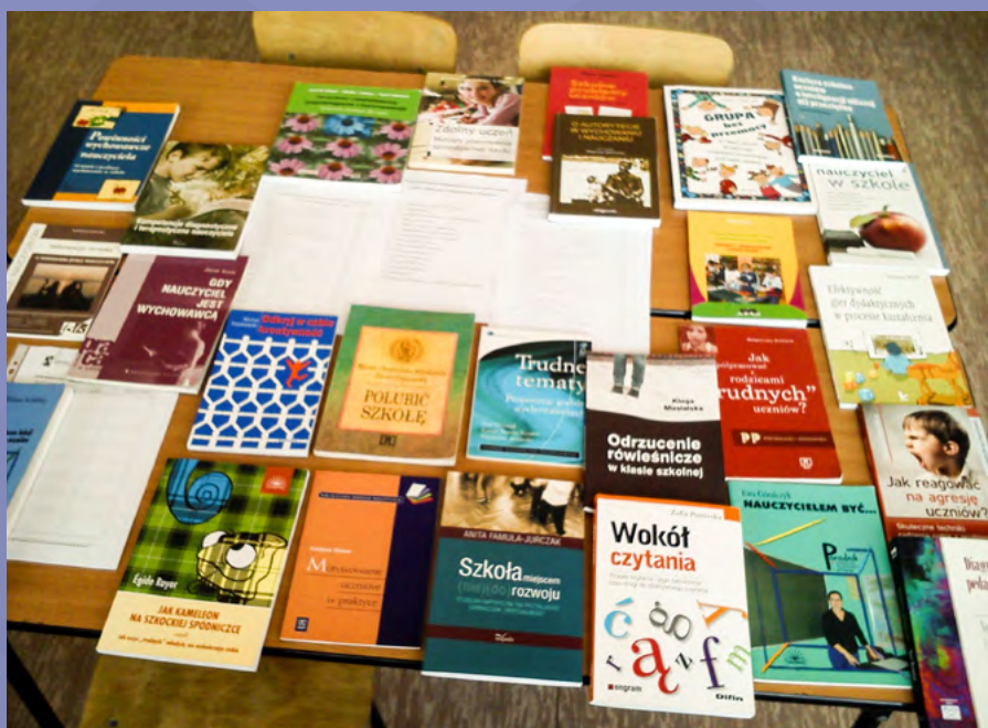
Przykładowy zestaw książek

Naprzeciw tym wymaganiom wychodzi także realizowany od 2010 r. przez Ośrodek Rozwoju Edukacji projekt „System doskonalenia nauczycieli oparty na ogólnodostępnym kompleksowym wspomaganie szkół” (Priorytet III Programu Operacyjnego Kapitał Ludzki, Działania 3.5 „Kompleksowe wspomaganie rozwoju szkół”). Celem realizacji projektu jest pilotażowe